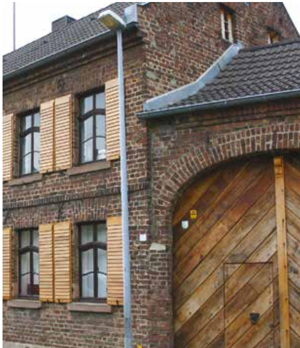
Alle Angaben ohne Gewähr / Änderungen vorbehalten. / Stand 20. August 2024

Veranstaltungsort: Pianomuseum Haus Eller Sindorfer Straße 19 • 50127 Bergheim-Ahe Tel.: 02271 / 70 72 05 • Fax: 02271 / 70 72 07 www.pianomuseum.de • info@pianomuseum.de